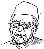
बाबूराव विष्णु पराङ्कर

श्री बाबूराव विष्णु पराङ्कर का नाम हिन्दी-सम्पादकों की प्रथम श्रेणी में आता है। उनका अधिकांश समय 'आज' का सम्पादन करते बीता। "पराङ्करजी जैसे प्रौढ़, गम्भीर तथा आदर्शवादी सम्पादक के नेतृत्व में 'आज' ने भाषा, भाव और शैली, विचार, विवेचन तथा विविधता, मौलिकता, नवीनता तथा गम्भीरता, आदर्शवादिता, जनसेवा तथा निर्भीकता की दृष्टि से दैनिक पत्रों के सामने नये धरातल की सृष्टि कर दी।" इसका अधिकतर श्रेय पराङ्करजी को ही था। 'आज' का सम्पादक नियुक्त होने से कुछ ही दिन पहले वह भागलपुर में नजरबन्द थे। कलकत्ता में कई वर्ष रह चुकने और प्रान्तिकारी युवकों से सम्पर्क रखने के कारण उनपर सरकार की सदा कड़ी नजर रही।